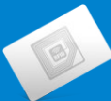
Cartão de proximidade RFID