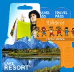
Cartões presente - Gift Cards