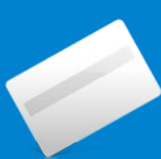
Cartão com painel de assinatura