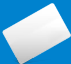
Cartão PVC Branco

Temos vários tipos de cartão disponíveis, desde o mais simple cartão PVC branco até cartões com chip eletrónico e tecnologia RFID. Salientamos a qualidade dos cartões para impressão a cores, fotografia e imagens.