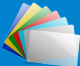
Cartões em diversas cores