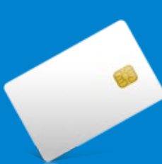
Cartão SmartCard com chip eletrónico