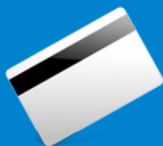
Cartão com banda magnética de alta coercividade